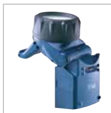
Schwenkbarer Leuchtenkopf Ermöglicht eine individuelle Ausrichtung des Lichtkegels