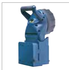
Lampe mit Wandhalterung Zur Montage an einer Wand oder im Fahrzeug geeignet