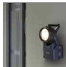
Notlichtfunktion Bei Stromausfall wird die Leuchte zur zuverlässigen Notbeleuchtung