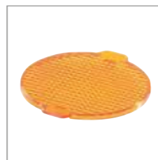
Warnlicht Dank Blinkfunktion und Streuscheibe als Warnleuchte einsetzbar